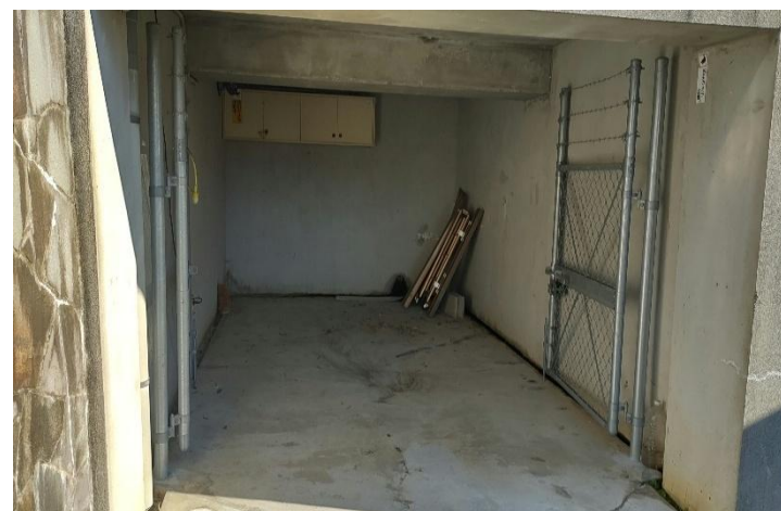
< 1階 >